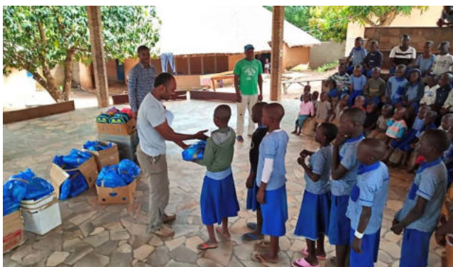
Übergabe von Schulmaterial an die Waisenkinder

Die finanziellen Mittel für den Betrieb und Unterhalt von Ausbildungszentrum und Schule aufzubringen stellt eine gewaltige Herausforderung dar. Obwohl das CFL einen Teil der Betriebskosten bereits aus Erlösen externer Aufträge bestreiten kann ist eine vollständige Kostendeckung aus eigener Kraft nicht möglich. Staatliche Unterstützung ist nicht in Aussicht.